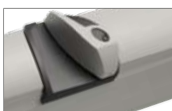
Serratura per sblocco manuale in metallo (di serie versione X )