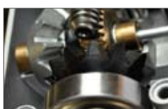
Ingranaggi e cuscinetti.