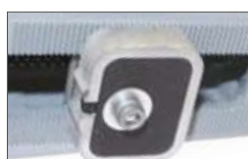
Stop meccanici/elettronici (di serie versione X )