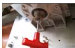
Riduttore in bagno d'olio.