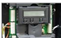
Centrale SEA 380 DG programmabile con display