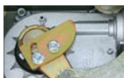
Stop meccanici regolabili in entrambe le direzioni.