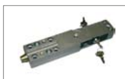
Sbocco Plus con leva e serratura di sicurezza.