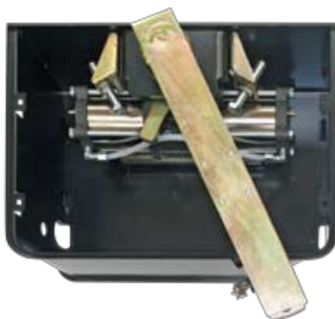
Jack 800 CP (cassetta portante)