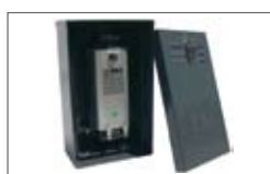
Cassetta centralina in acciaio zincato e verniciatura poliestere con serratura (inclusa).